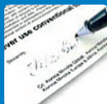
Обычный тонер с силиконовым маслом

Полимеризованный тонер Simitri® HDE не содержит масла, поэтому на готовых материалах можно писать шариковыми ручками, фломастерами и т.п. Это расширяет возможности типографий: теперь они могут производить все виды чёрно-белых и цветных материалов, например, рабочие тетради, где можно делать отметки. Это очень удобно! Потребители вашей продукции по достоинству оценят материалы, напечатанные на оборудовании Konica Minolta.