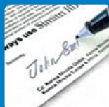
Полимеризованный тонер Simitri® HDE